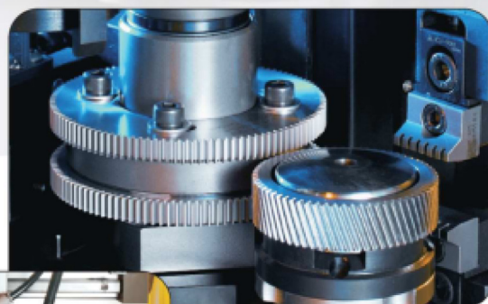
倒角刀具 Deburring cutter.